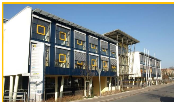
Obrázek: Inovační centrum Bautzen

Navštivte naše webové stránky nebo facebook pro aktuální informace.