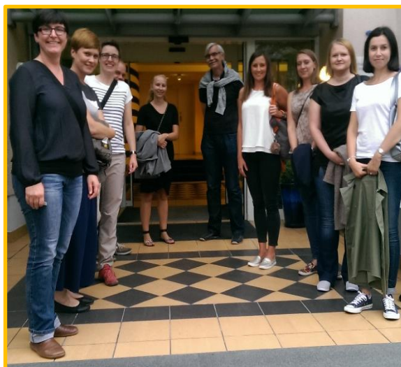
Obrázek: projektový tým projektu TRANS 3 Net

rádi bychom Vám představili náš první newsletter k projektu TRANS 3 Net, který odstartoval v červenci 2016 pod programem Interreg Central Europe. Cílem projektu TRANS 3 Net je vytvoření nadnárodní kooperační sítě poskytovatelů transferu inovací na území tří států/regionů - Německo (Saska), Polsko (Dolního Slezska) a České republiky (Ústeckého kraje). Poskytovatelé transferu působí ve fázi zahájení, implementace a podpory znalosti a technologického transferu mezi vědou a průmyslem. Lze je najít ve vědeckých organizacích (např. oddělení transferu), v organizacích majících blízky vztah k ekonomickým subjektům (např. okresní hospodářské komory) a zprostředkujících organizacích (např. technicko-vědecké parky) a také samozřejmě ve veřejné správě (např. agentury podporující rozvoj podnikání). Pomáhají překonat bariéry mezi vědou a průmyslem, které brání vzájemné spolupráci.