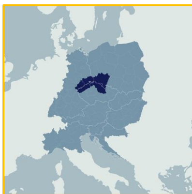
Obrázek: Analyzované trojmezí mezi Německem, Českou republikou a Polskem

V nejbližší době bude zahájen průzkum podporovatelů transferu na trojmezí Německa, České republiky a Polska. Cílem tohoto šetření bude představení profilu všech podporovatelů transferu, kteří jsou aktivní v daném regionu a přispívají k iniciaci a implementaci transferu inovací. Průzkum bude prováděn na základě dotazníku, který byl vytvořen ve spolupráci všech partnerů během prvních měsíců projektu. Šetření bude zahájeno v lednu 2017.