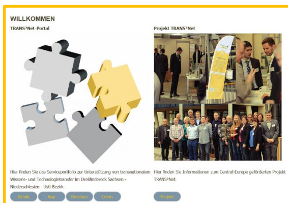
Obrázek: Nový TRANS 3 Net-Portal.

Každá síť potřebuje ke svému fungování členy. Více než 60 podporovatelů transferu ze všech tří zemí se již prezentuje se svými službami v oblasti transferu na naší mapě podporovatelů transferu, vč. univerzit, výzkumných institucí, firem, veřejných institucí a asociací. Zainteresované instituce a osoby, které nabízejí služby v oblasti mezi vědou a ekonomikou nebo mezi nimi navazují kontakty, jsou vždy vítány, aby se staly součástí sítě podporovatelů transferu. Registrace je možná online pomocí dotazníku, ale také prostřednictvím textového dokumentu. Dotazník lze stáhnout. Obě možnosti jsou blíže popsány na www.trans3net.eu v sekci TRANS 3 Net-Portál - “registrace”.