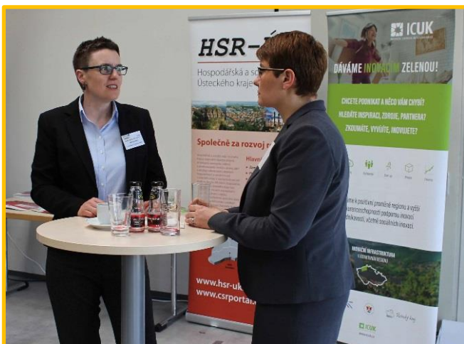
Obrázek: Konverzace v rámci přeshraniční akce podporovatelů transferu v Budyšině.

“V roce 2025 je příhraniční region Saska, Dolního Slezska a Ústeckého kraje charakterizován čilou výměnou znalostí a nových technologií. Polské, české, německé univerzity a výzkumné instituce spolupracují na aplikaci nejnovějších vědeckých objevů a technologií do praxe a průmyslového užívání ve prospěch evropských firem.”