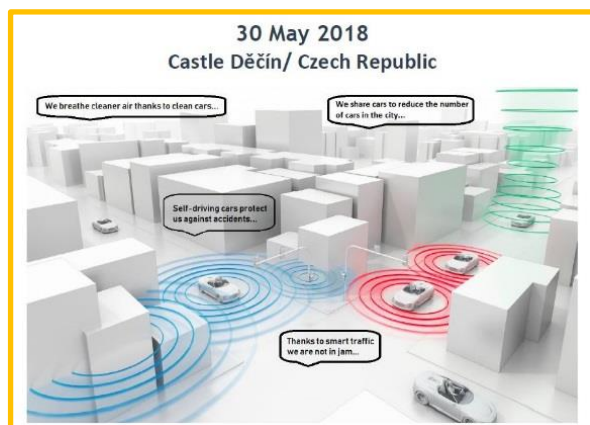
Simulace autonomní dopravy, která bude tématem veletrhu v květnu 2018.

SMART MOBILITA - hudba budoucnosti: čistá, sdílená, inteligentní, mobilní a samoříditelná. Toto je téma našeho prvního veletrhu TRANS 3 Net. Veletrh je pojat jako výstava aplikovatelných výsledků výzkumu, která je základním krokem pro potenciální spolupráci. Srdečně tak zveme výzkumné instituce, univerzity a technologické agentury, aby zde prezentovaly své záměry, projekty a využitelné výsledky výzkumu v oblasti inteligentní mobility. Bylo by dobré představit něco, co je hmatatelné a srozumitelné pro návštěvníky. Na druhé straně zveme vědce, zaměstnance malých a středních podniků a obcí ze Saska (Německo), Dolního Slezska (Polsko) a Ústeckého kraje (Česká republika), které se zabývají inteligentní mobilitou. Pozvánka je k dispozici zde .