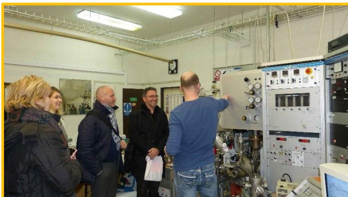
Prohlídka laboratoří UJEP v únoru 2018.

Nanotechnologie a moderní materiály byly tématem druhé tzv. TRANS 3 Net.visit začátkem února 2018 v Ústí nad Labem. Celkem 28 účastníků z vědecké sféry a z malých a středních podniků navštívilo prostory Přírodovědecké fakulty, Fakulty strojního inženýrství a Fakulty životního prostředí Univerzity J. E. Purkyně v Ústí nad Labem. Okružní prohlídka různých laboratoří přinesla vědcům, podporovatelům transferu a zaměstnancům malých a středních podniků zajímavý pohled na současnou situaci výzkumu na UJEP. Účastníci ocenili zejména rozmanitost a možnost výměny zkušeností s